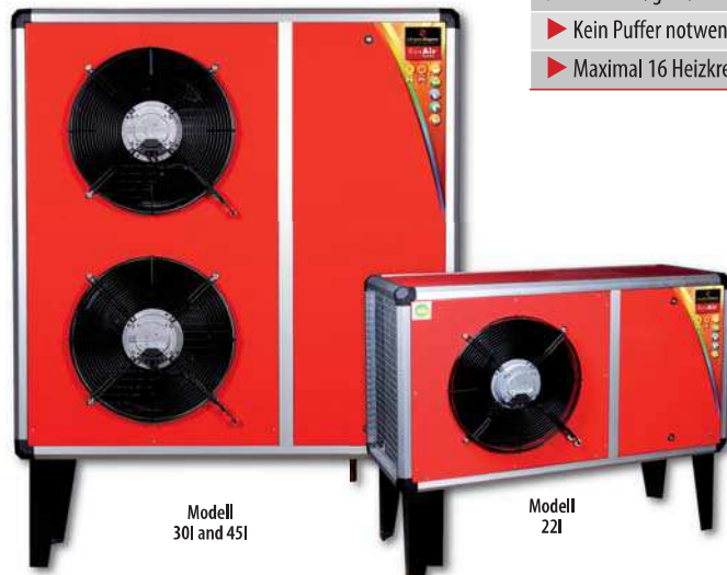
Modell 30I and 45I